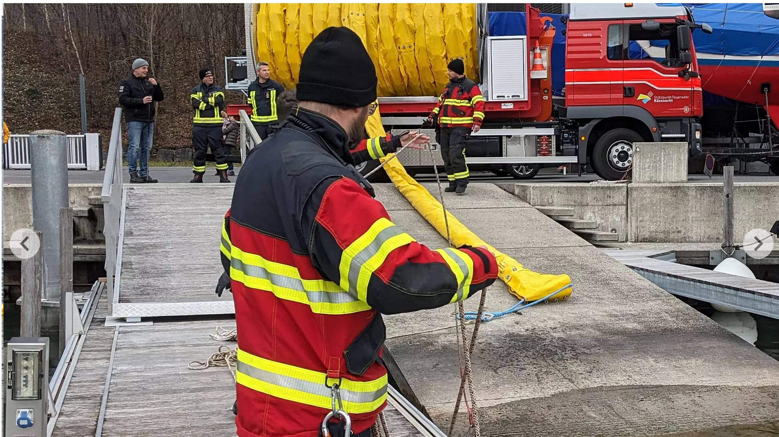
Die Sperre der Küssnachter Kollegen stand derweil im Hafen bereit.

Beim Bootshafen Fallenbach breitete sich am Sonntagmittag eine grössere Menge Treibstoff auf dem Wasser aus. Es brauchte mehrere Hundert Meter Ölsperre. Die Polizei sucht Zeugen.