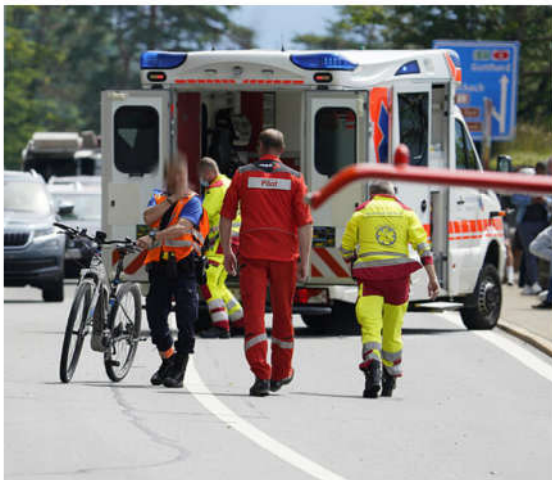
Ein Velo, das in den Zwischenfall verwickelt war, wurde durch die Polizei weggebracht.